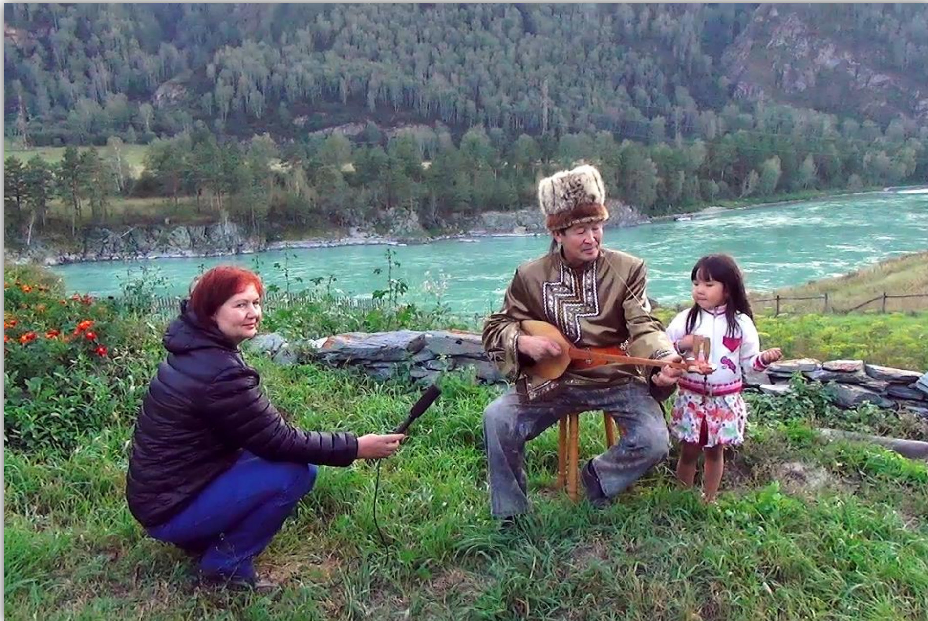
На съёмках очерка «Предназначение»