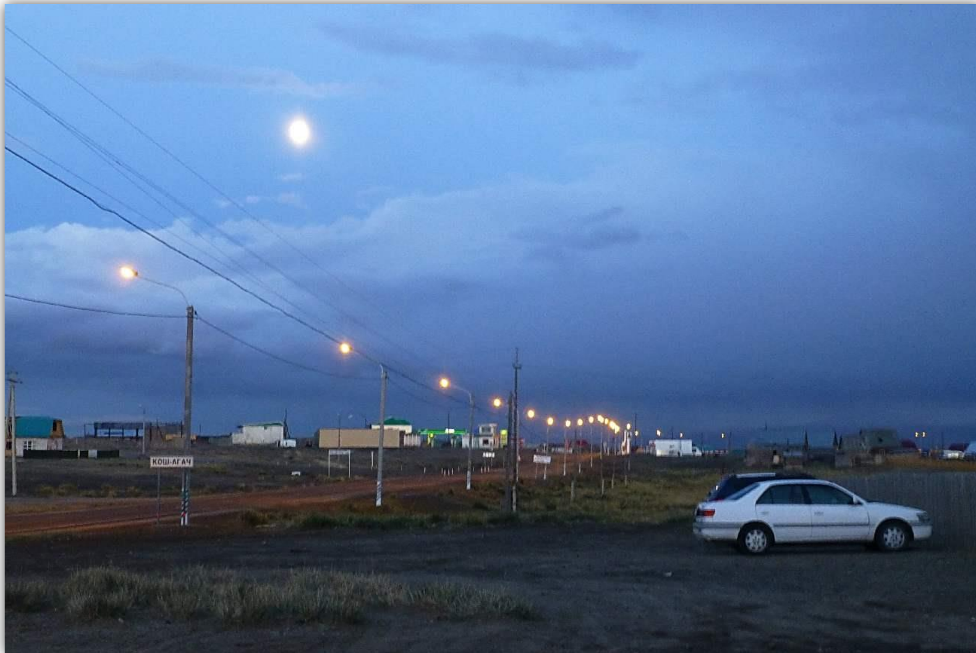
Ночь в Кош-Агаче