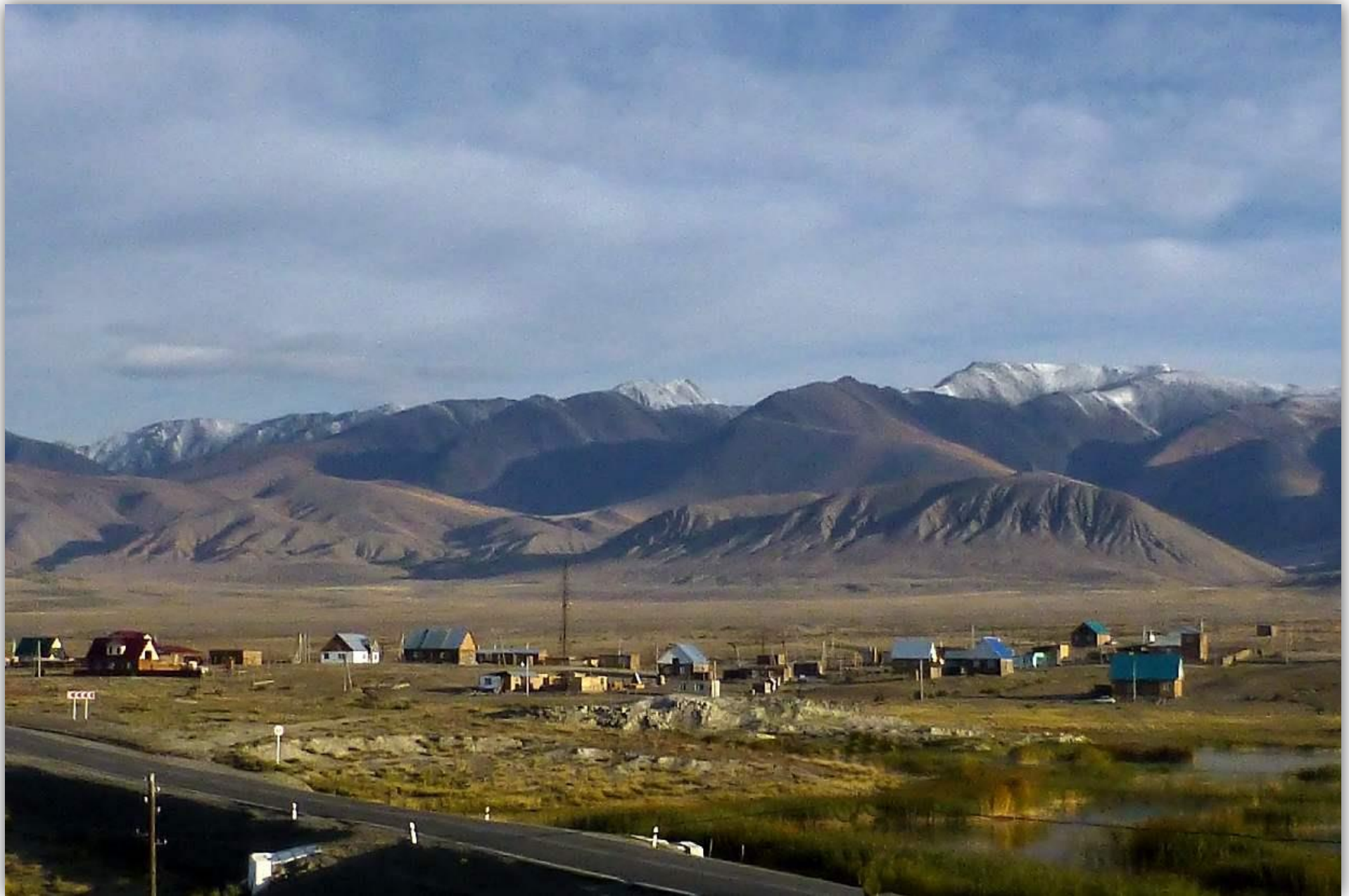
Утро в Кош-Агаче