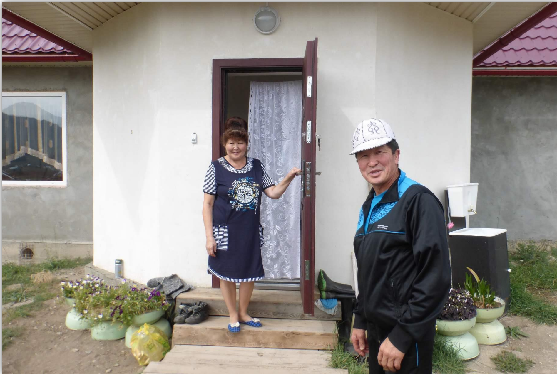
Ещё одна сестра Карыша