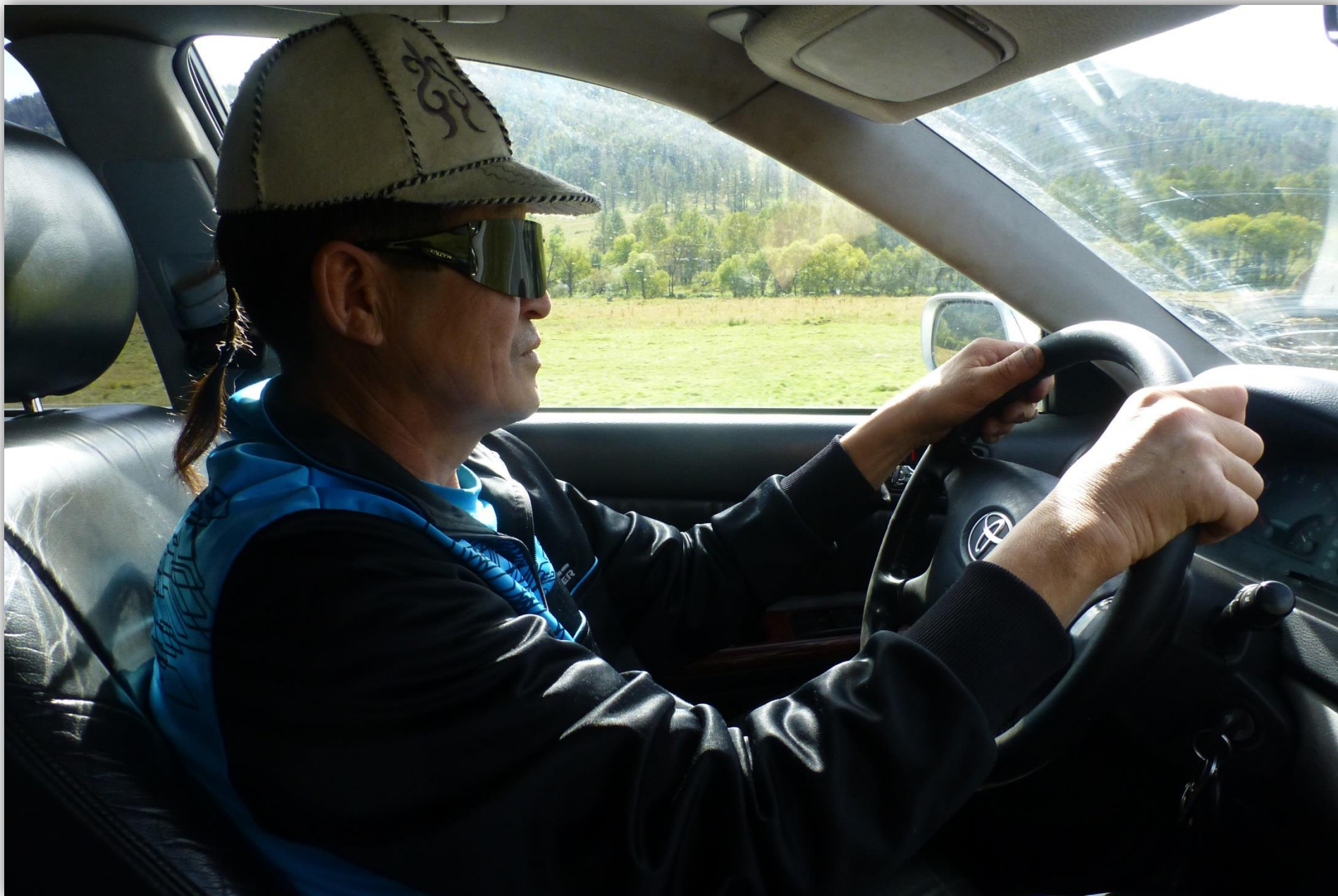
Поездка в Кош-Агач