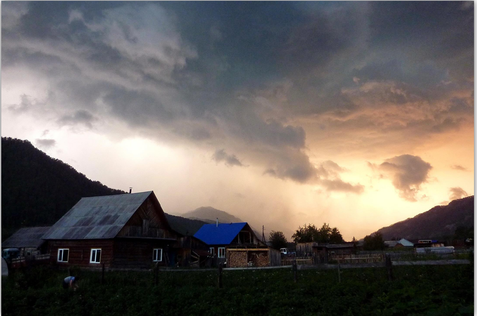
Вечер в Чепоше