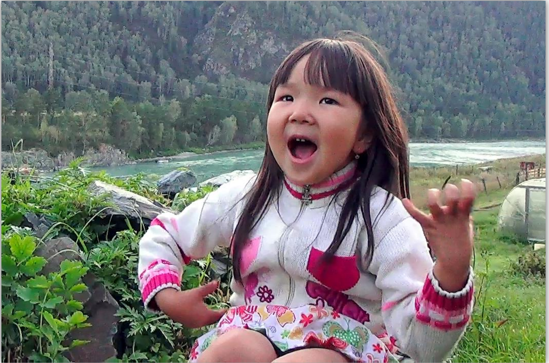
Кадр из очерка «Предназначение»