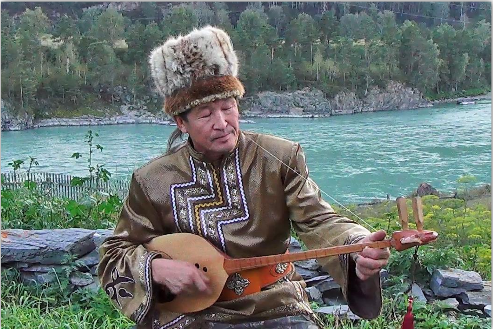
Кадр из очерка «Предназначение»