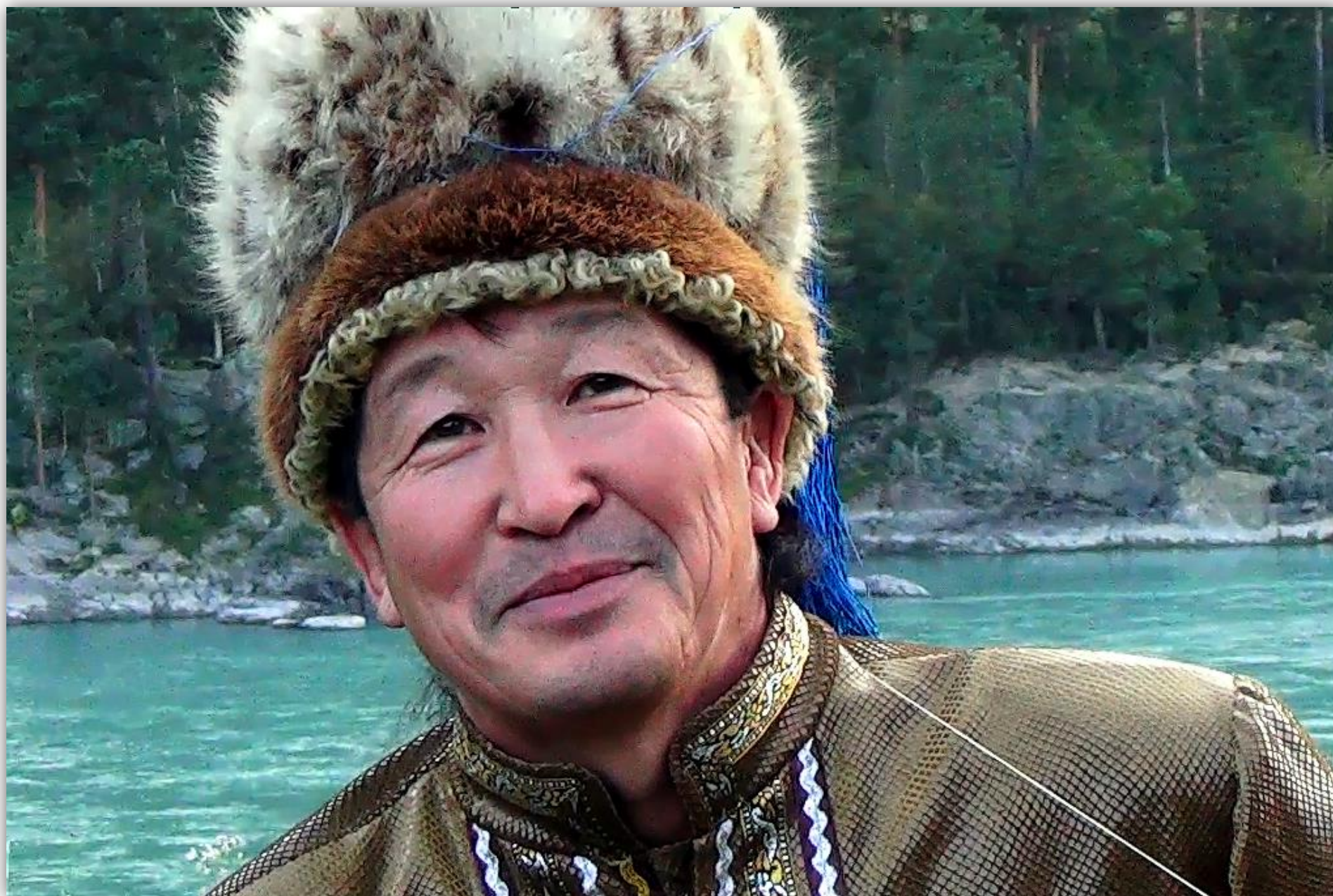
Кадр из очерка «Предназначение»