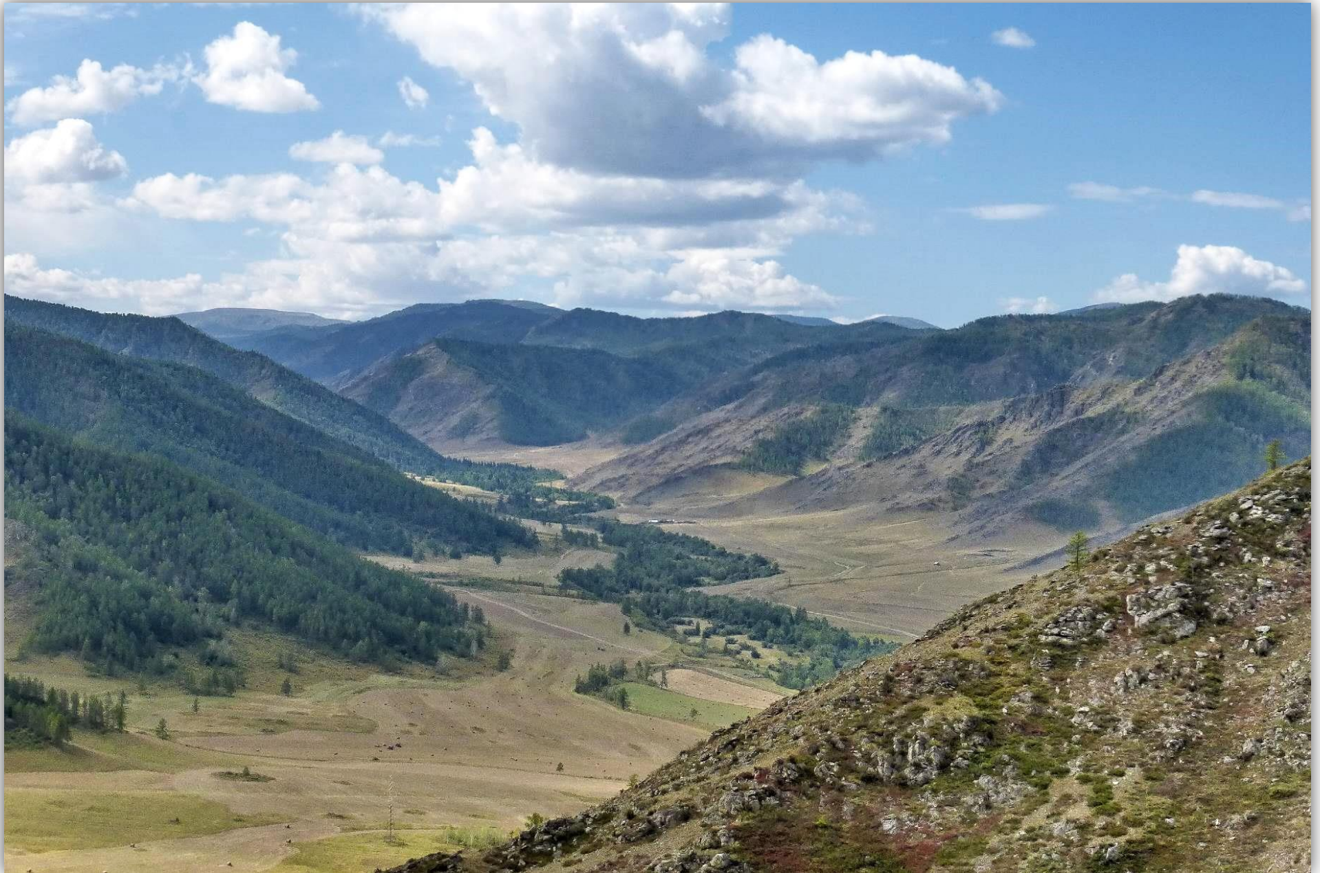
Вид с перевала Чике-Таман