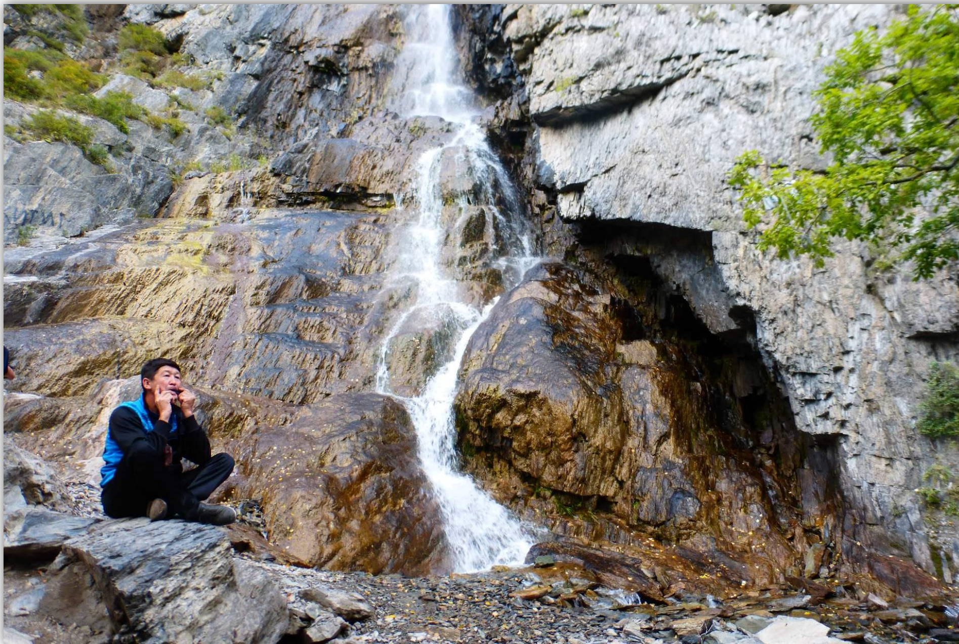
Водопад «Девичьи слёзы»