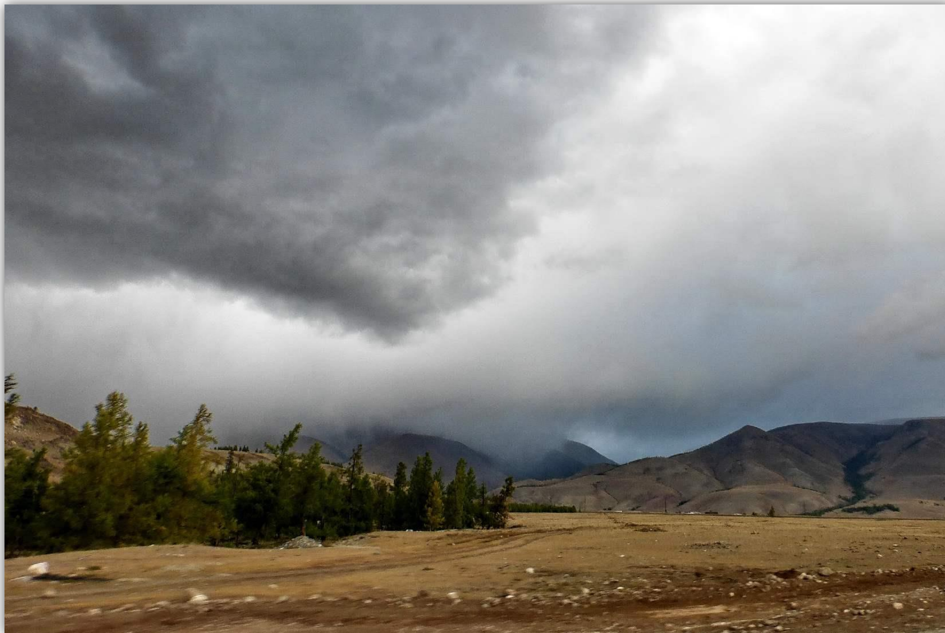
«Буря мглою, небо кроет...»