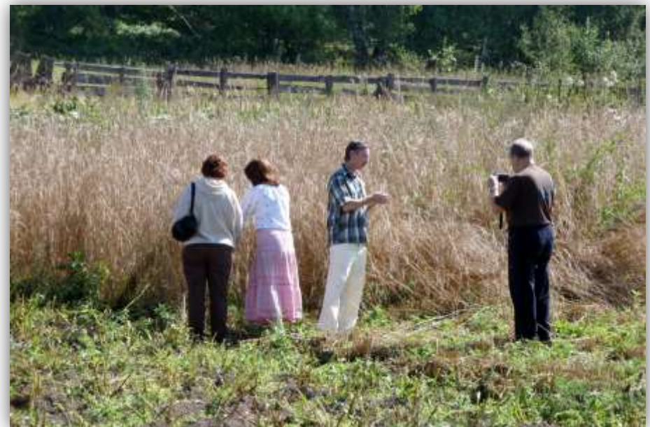
Экскурсия по огороду