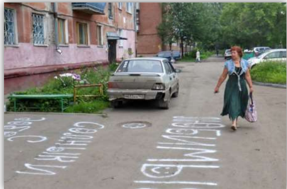
25 августа 8 часов утра