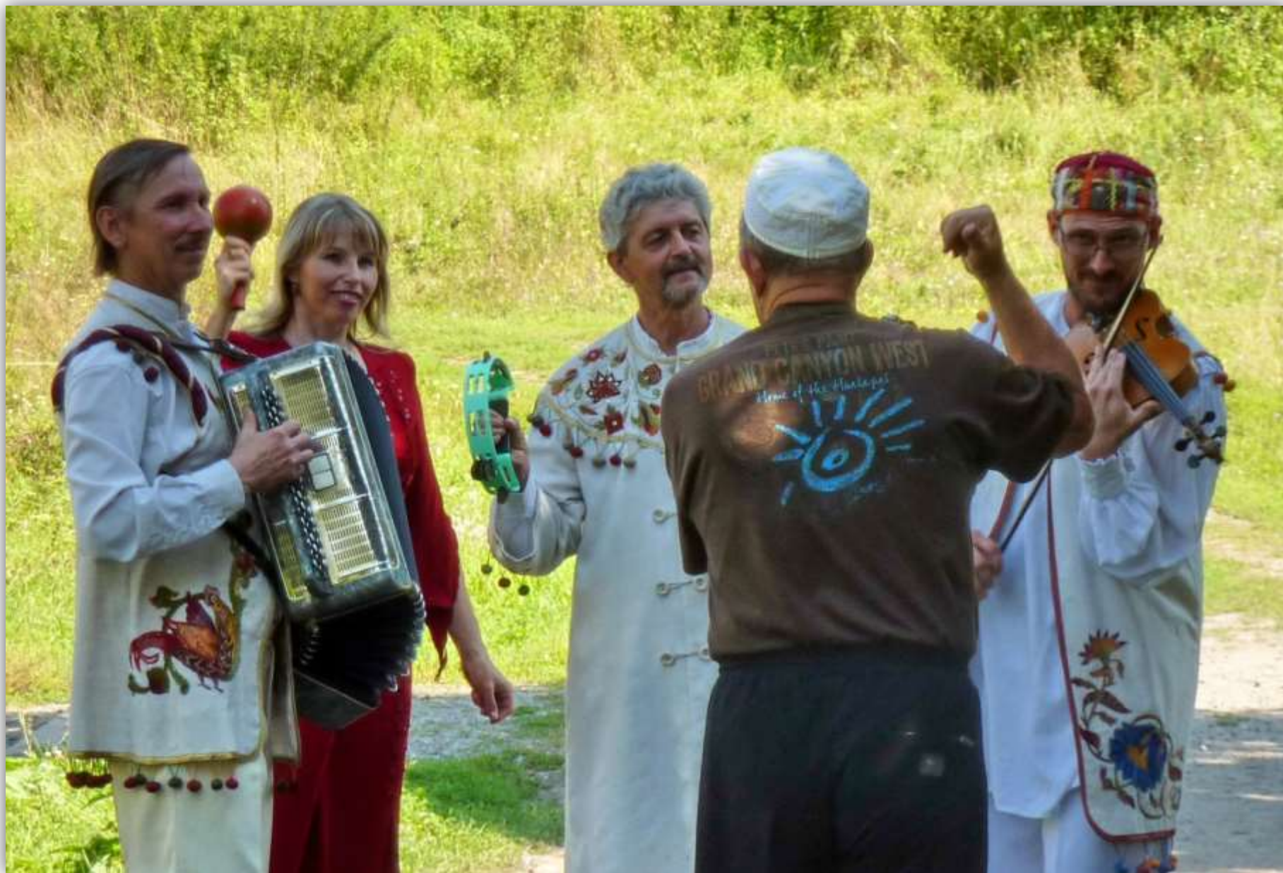
«Ещё один дубль, пожалуйста...»