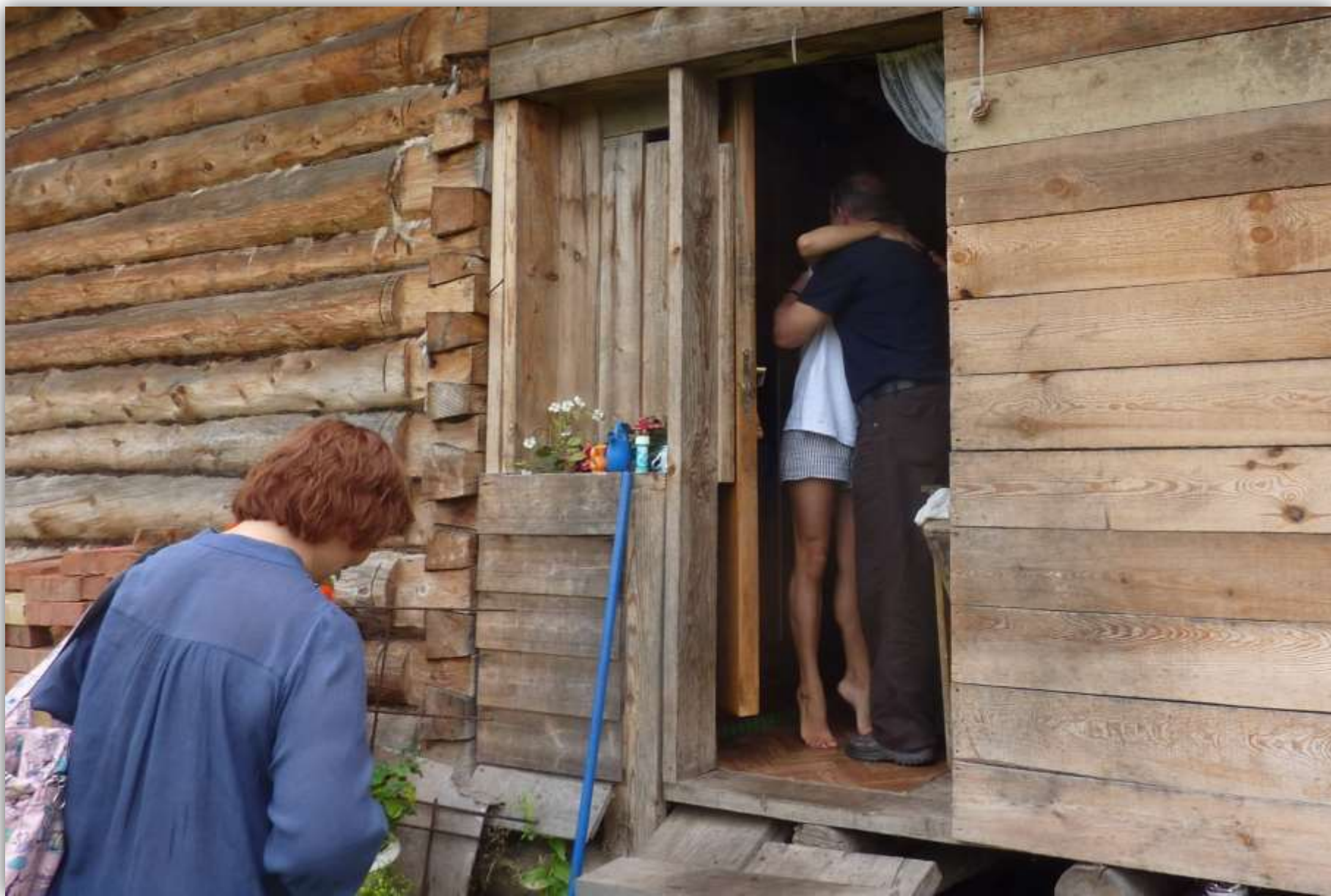
Здравствуй, Маша. я - Дубровский