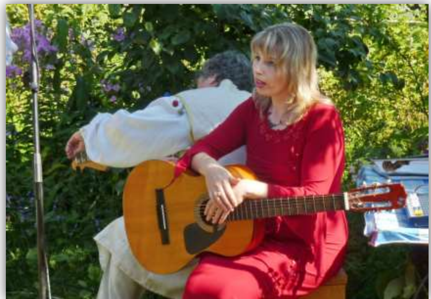
Підготовка к виступленню