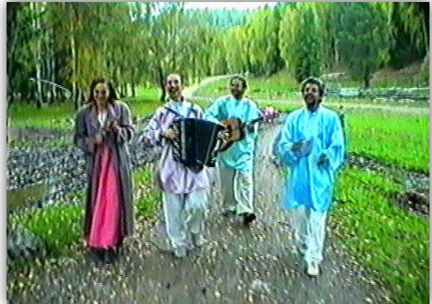
Кадры из очерка «Черемшанский рок-н-ролл» 2001 год