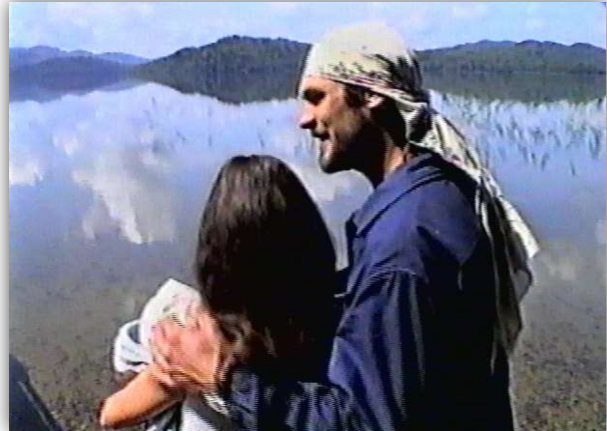
Кадры из очерка «Остров» 2000 года