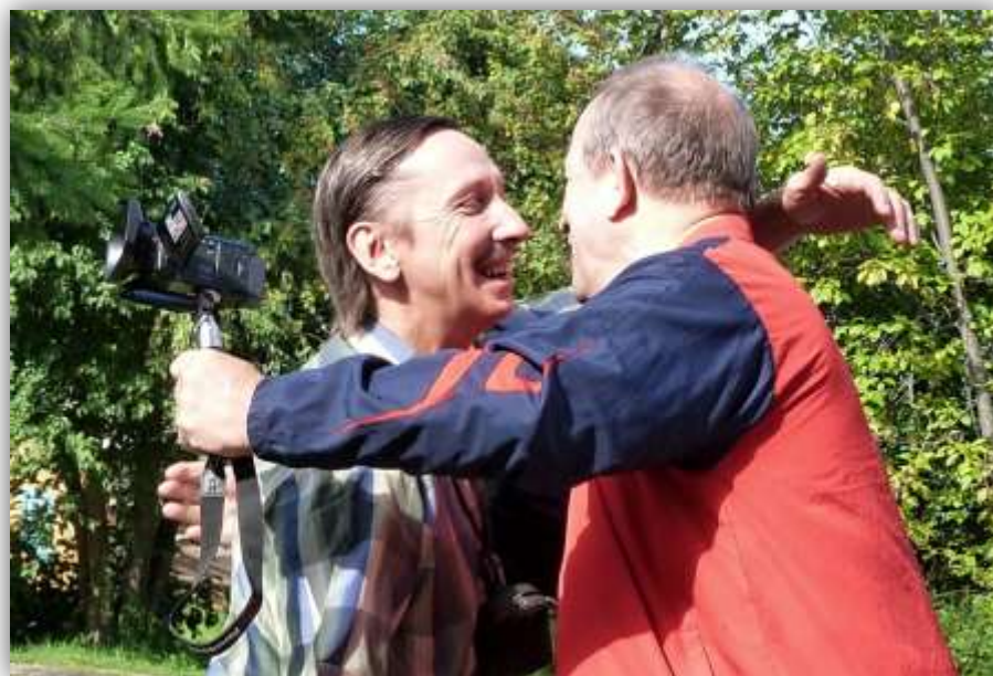
Встреча в Курагино