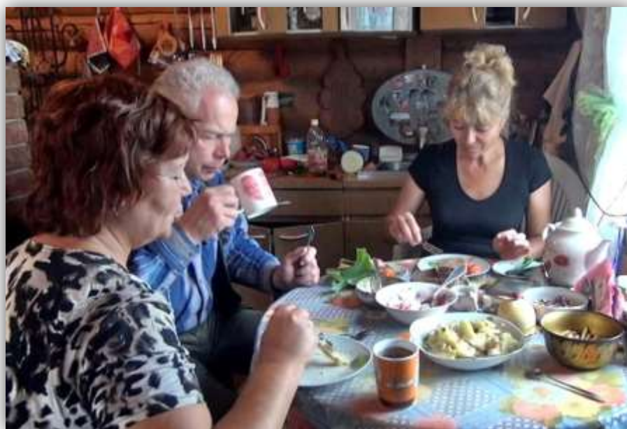
Завтрак в деревне Петропавловка