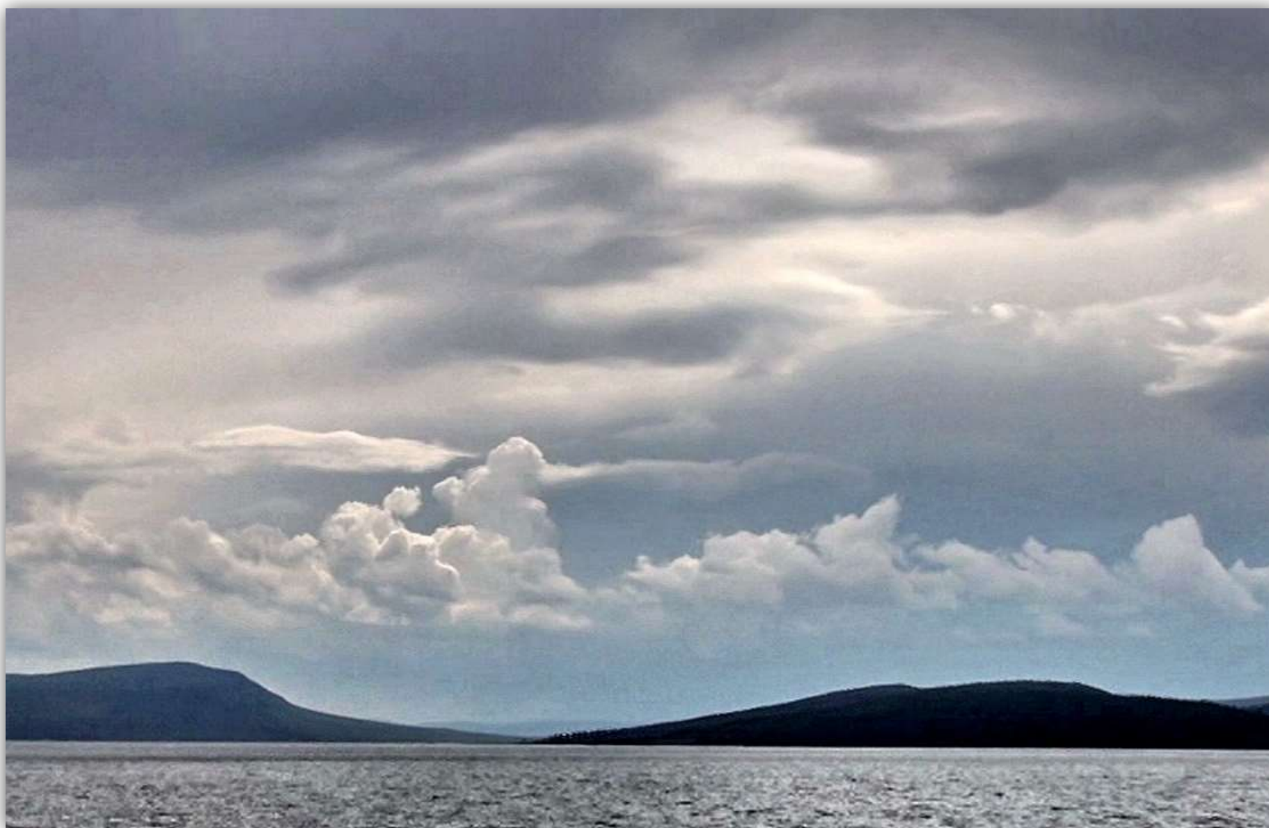
Озеро Большое у села Парное