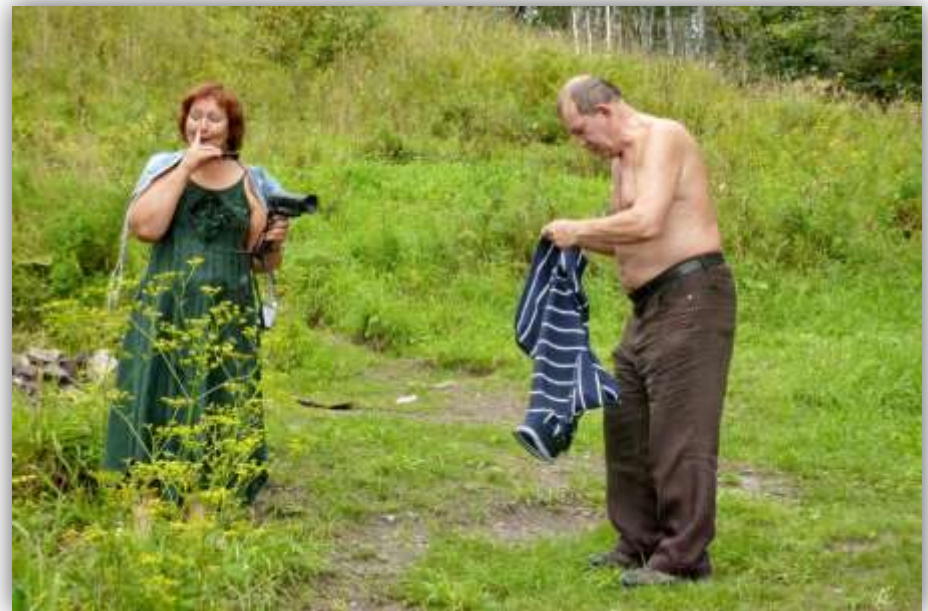
На озере Инголь