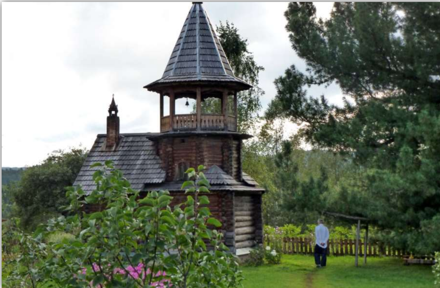
Часовня в Гуляевке