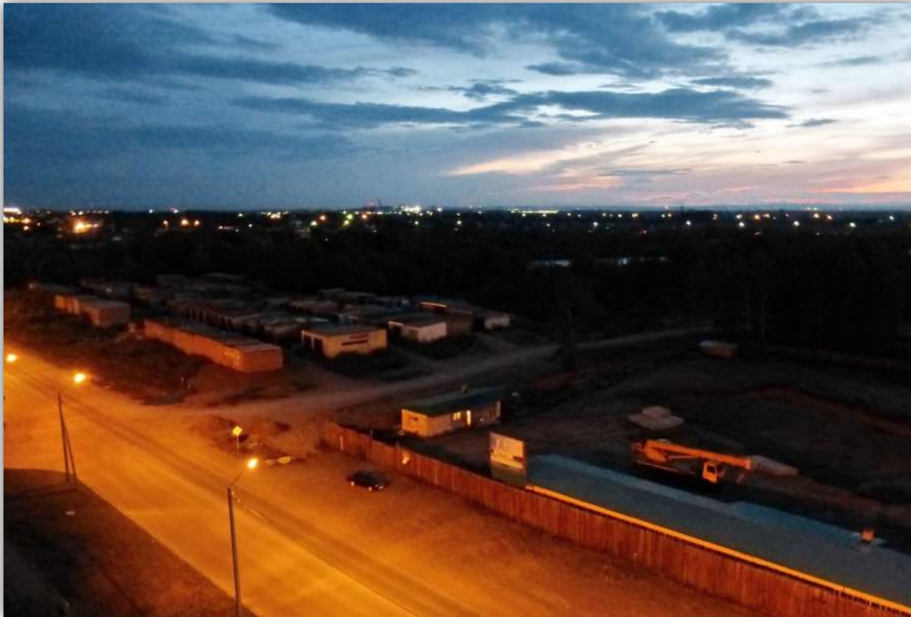
Ночь в Абакане за 1.5 тысячи на всех в 2-х комнатной квартире