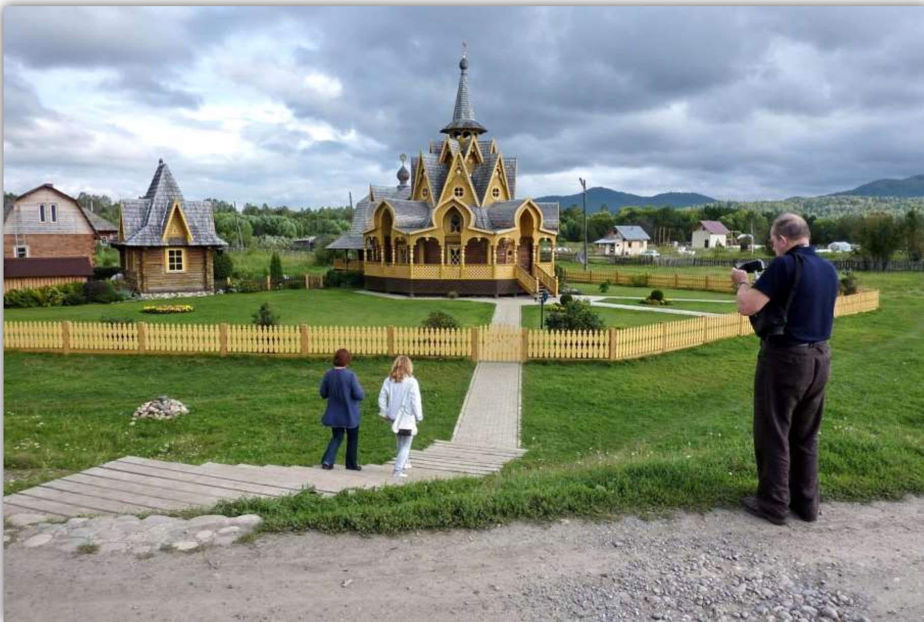
Собор в Петропавловке